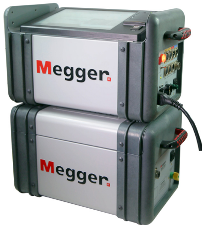
DELTA4310A muestra de equipo de prueba con computadora